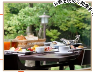
お堀を眺めて朝食を。

金沢城公園・兼六園に近いホテル。ホテルより、半径1キロ圏内に主要観光名所があります。 歴史と伝統が今に息づく城下町・金沢。「兼六園」や「ひがし茶屋街」、「近江町市場」、 「金沢21世紀美術館」、「長町武家屋敷」と、名所旧跡にも近く、豊かな自然と情緒が満喫できる 絶好のロケーションです。どこへでも歩いて行ける立地です。